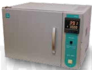
Термостат ТАГЛЕР для пробирок модель ИСА - 45HT