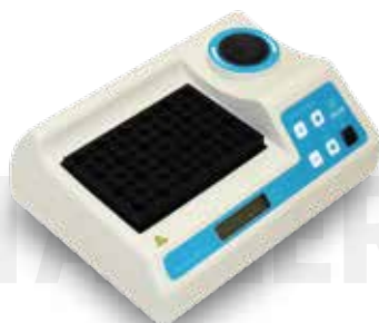
Термостат ТАГЛЕР для пробирок Модель HT-120