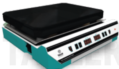
Плита нагревательная TAGLER модель ПН - 4030