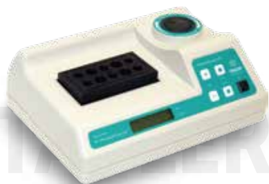
Термостат ТАГЛЕР для пробирок модель HT- Plasmolifting Gel