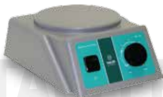
Мешалка магнитная TAGLER модель MM 135