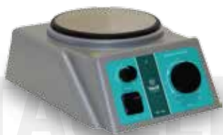
Мешалка магнитная TAGLER модель MM 135 H