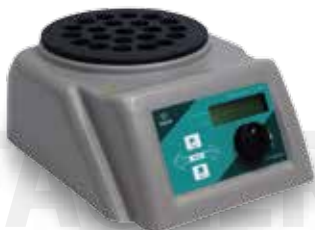
Термостат ТАГЛЕР для пробирок Модель HT-170 ХПК